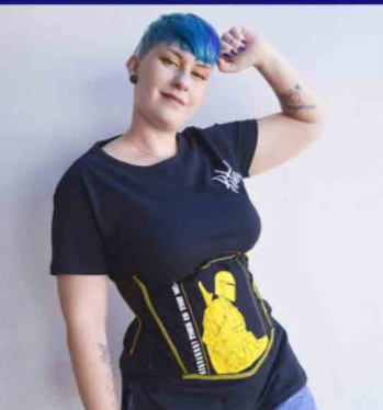
Ação Tekbond + Piticas