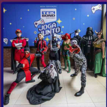
Convenção Tekbond "Joga Junto" 2022

Participei da Escolar Office Brasil com a Tekbond em 2023