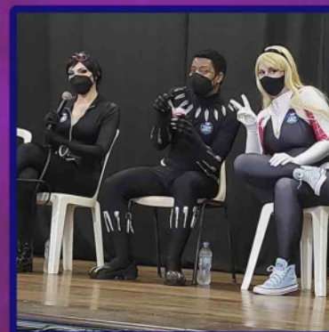
Palestra feita na GeekFest