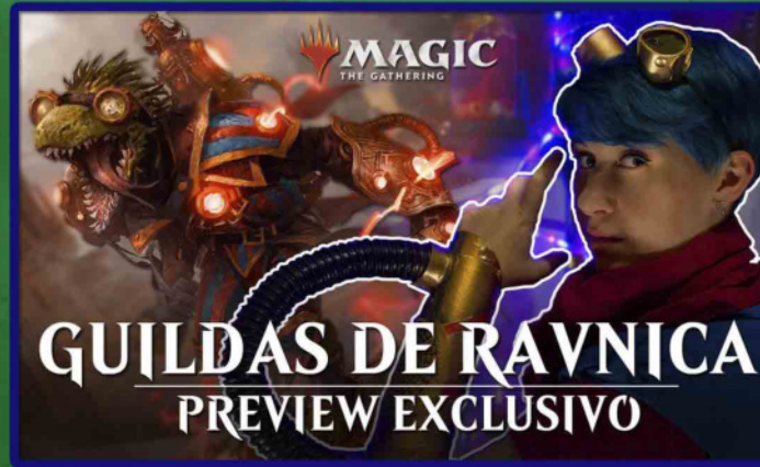
Conteúdos para as redes sociais de Magic the Gathering