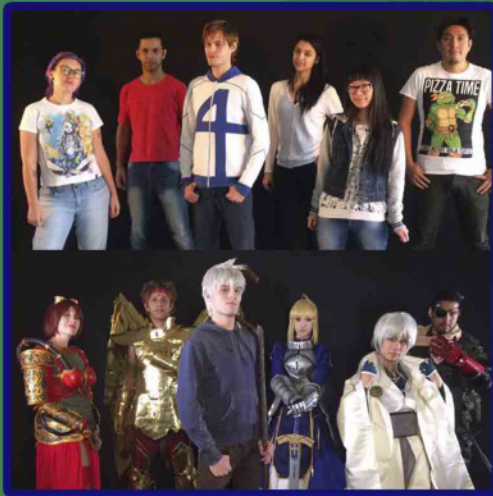
trabalho de personagem vivo para gravação