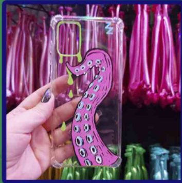
criação para divulgar lançamento de loja